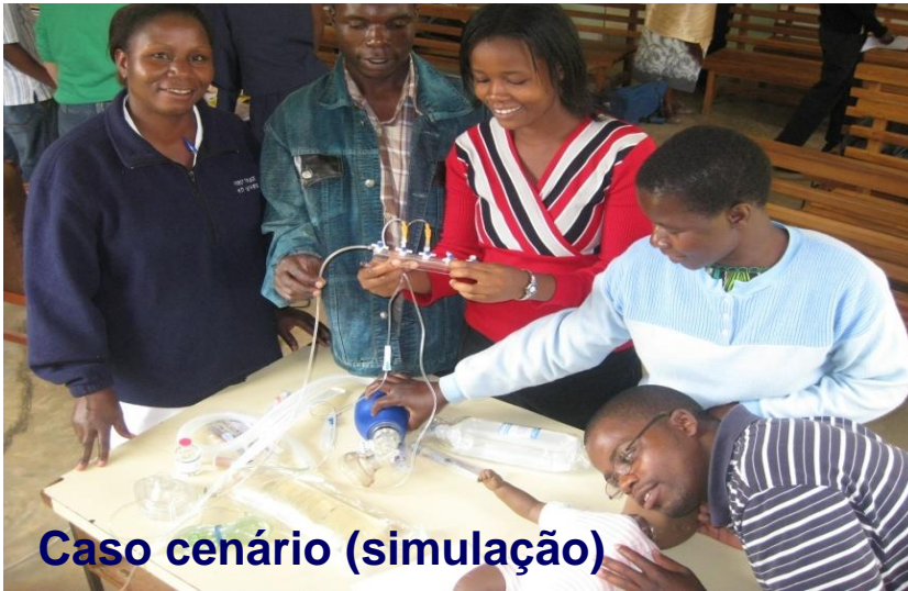
Caso cenário (simulação)