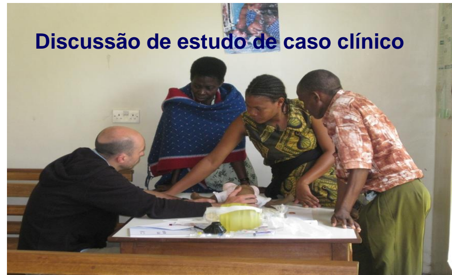
Discussão de estudo de caso clínico