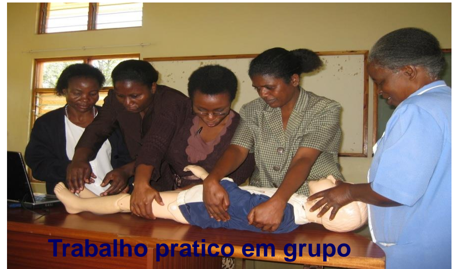
Trabalho pratico em grupo