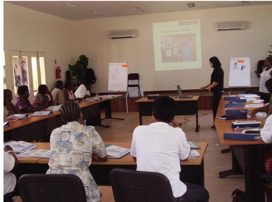
Palestra ilustrada com multimídia e flipchart.

O uso de diferentes meios de apoio audiovisual em uma mesma sessão a torna dinâmica, menos monótona.