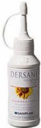
Cremes e óleos a base de Ácido Graxo Essencial (AGE)