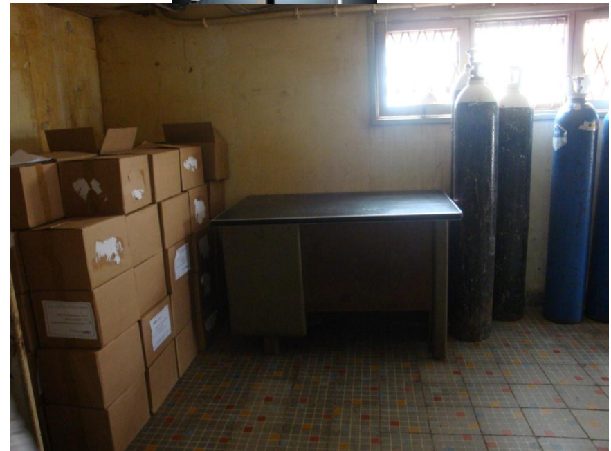
Caixas de soro armazenadas na área de esterilização