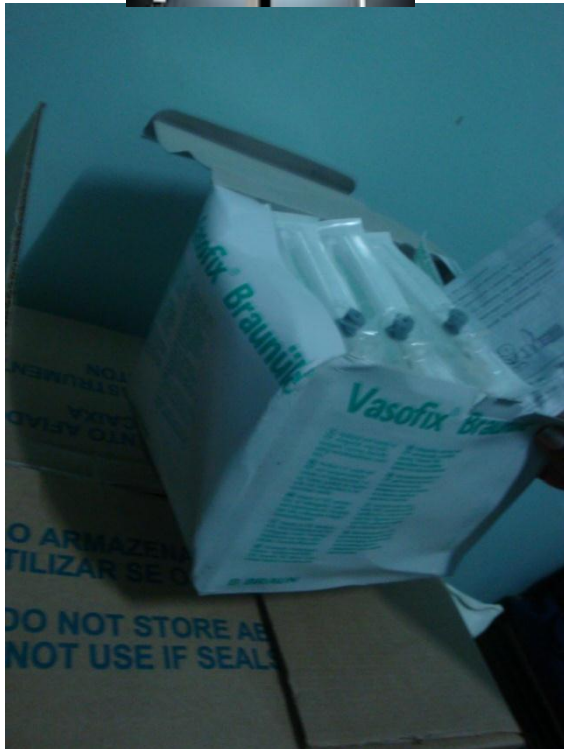
Seringas armazenadas no recobro.