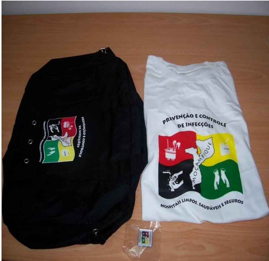
Materiais de campanha