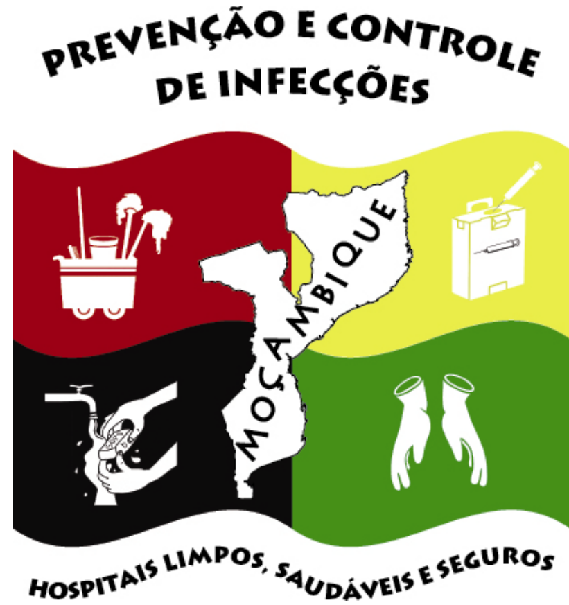
Selo de qualidade em PCI